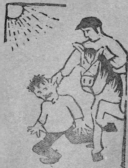
за ушко на солнышко